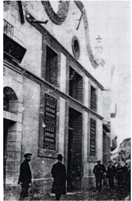
Edifici de la Dàlia Blanca. Any 1910